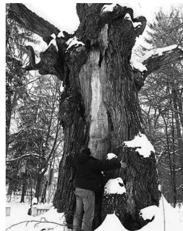
Юзефінський дуб. Обхват 8 метрів.

За матеріалами газети «Сьогодні» та «Української правди. Життя».