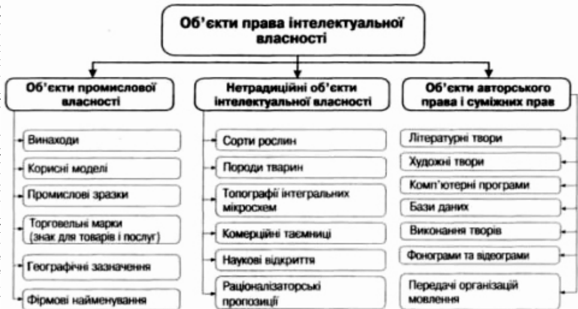
Рис. 1. Класифікація об'єктів права інтелектуальної власності

Вони мають таку назву тому, що застосовуються, головним чином, у промисловості. До другої групи належать штучно виділені, так звані нетрадиційні об'єкти інтелектуальної власності, що використовуються не тільки у промисловості. Нарешті, третю групу складають об'єкти авторського права і суміжних прав. Ця група має значні відмінності від об'єктів промислової власності як у процесі набуття прав, так і за строком їхньої дії. На відміну від об'єктів авторського права, права виконавців творів, виробників фонограм і аудіограм, а також організацій мовлення відносяться до суміжних прав, тобто прав, суміжних з авторськими правами.