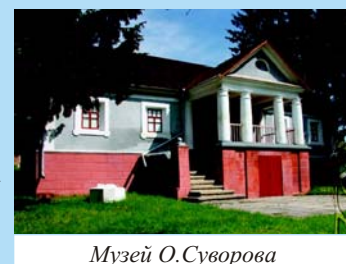
Музей О. Суворова