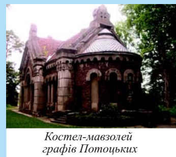
Костел-мавзолей графів Потоцьких